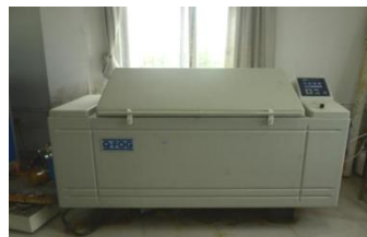
图 11 循环盐雾腐蚀试验箱