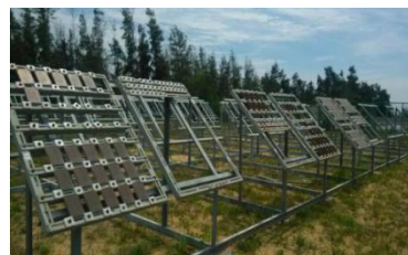
图 2 湛江大气腐蚀试验站暴露场