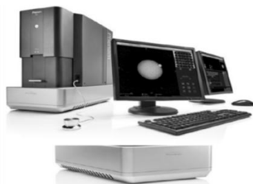
图 5 桌上型扫描电子显微镜 (SH5000M) + 增强型能谱仪