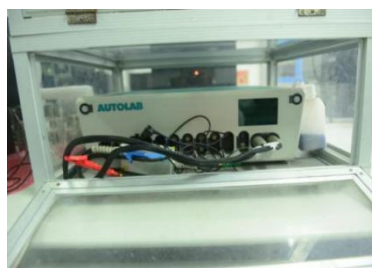
图 7 电化学工作站