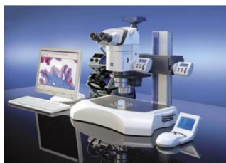
图 9 德国/蔡司体视显微镜