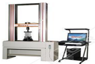
图 6 微机控制应力腐蚀试验机