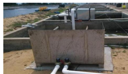
图 3 试验站实海加速腐蚀试验装置