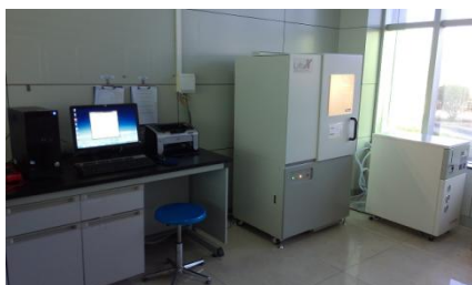
图 13 X 射线衍射分析仪 (XRD)