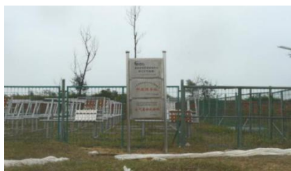
1 湛江大气腐蚀试验站全景