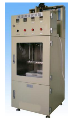
图 12 周浸腐蚀试验箱