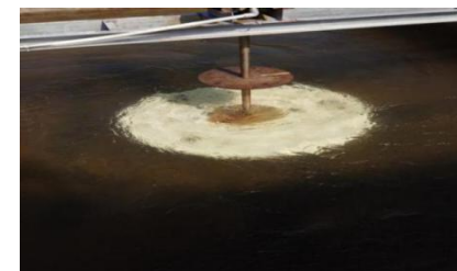
图 4 试验站海水冲刷腐蚀试验装置