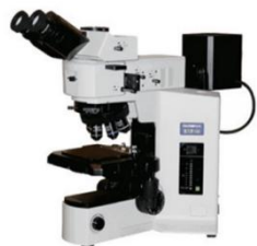
图 10 奥林巴斯金相显微镜