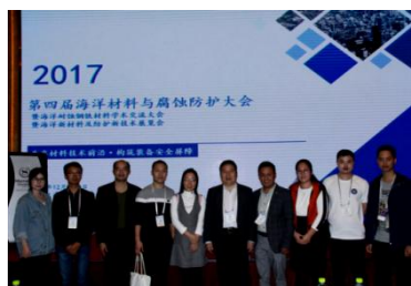
图 14 承办第四届海洋材料腐蚀防护大会